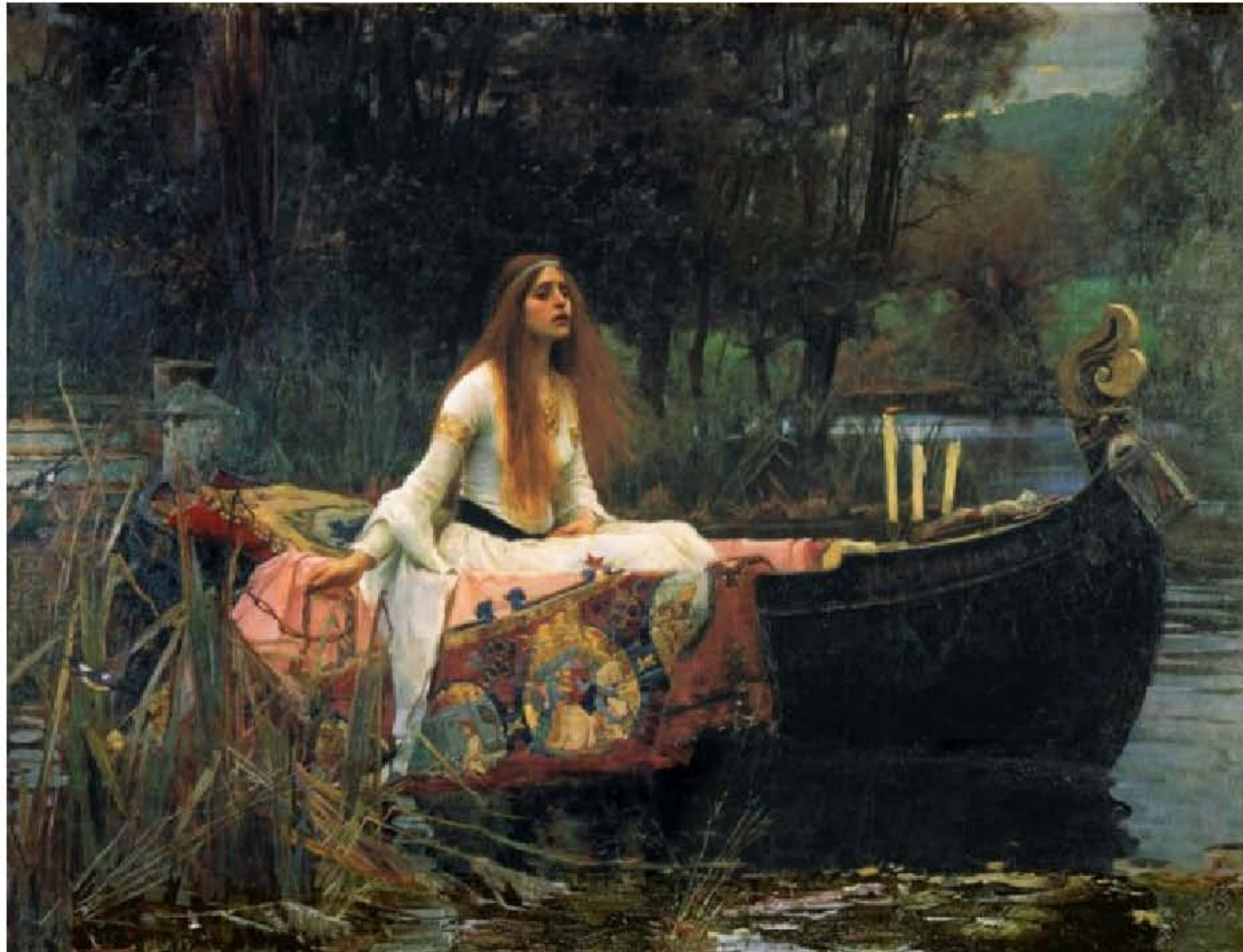
The lady of Shalott